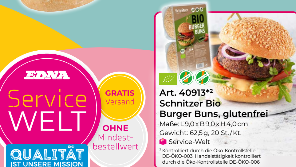
Art. 40913*2 Schnitzer Bio Burger Buns, glutenfrei Maße: L9,0x B9,0x H4,0cm Gewicht: 62,5g, 20 St./Kt. 📦 Service-Welt

2 Kontrolliert durch die Öko-Kontrollstelle DE-ÖKO-003. Handelstätigkeit kontrolliert durch die Öko-Kontrollstelle DE-ÖKO-006