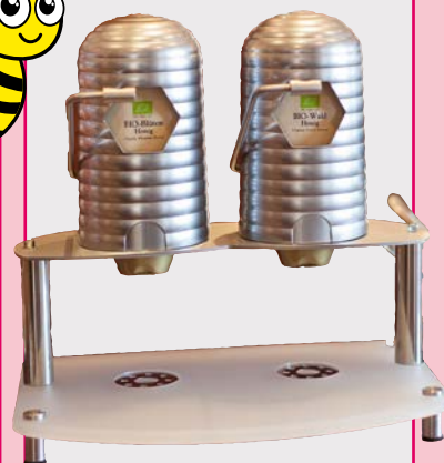
Art. 62711* Dispenser „HoneyMat“, 2 Zapfstellen, schwarz

Maße: L 23,0 x B 29,0 x H 29,0 cm Gewicht: 10 kg, 1 St./Kt.