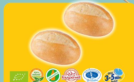
Art. 1111*1 FF-Bio Mini- Knusperbrötchen Maße: L9,5x B6,5x H4,5cm Gewicht: 35g, 140 St./Kt. ❄️ fertig gebacken