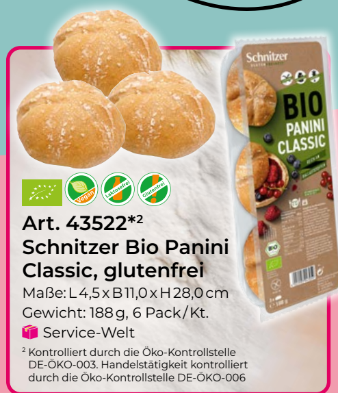
Art. 43522*2 Schnitzer Bio Panini Classic, glutenfrei Maße: L4,5x B11,0x H28,0cm Gewicht: 188g, 6 Pack./Kt. 📦 Service-Welt

2 Kontrolliert durch die Öko-Kontrollstelle DE-ÖKO-003. Handelstätigkeit kontrolliert durch die Öko-Kontrollstelle DE-ÖKO-006