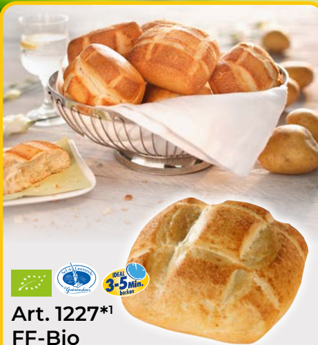
Art. 1227*1 FF-Bio Kartoffelbrötchen Maße: L9,5x B8,0x H4,5cm Gewicht: 60g, 40 St./Kt. ❄️ fertig gebacken