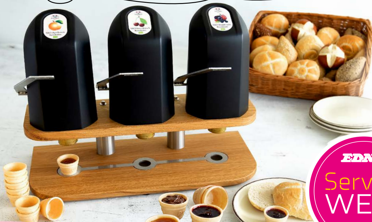
Art. 62726* Dispenser 2.0 mit 3 Zapfstellen, schwarz

Maße: L 23,0 x B 50,0 x H 34,0 cm Gewicht: 15 kg, 1 St./Kt. Service-Welt