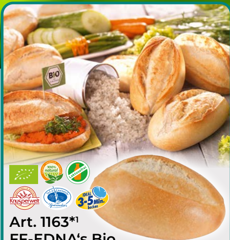
Art. 1163*1 FF-EDNA's Bio Knusperbrötchen Maße: L11,5x B8,0x H5,5cm Gewicht: 70g, 80 St./Kt. ❄️ fertig gebacken