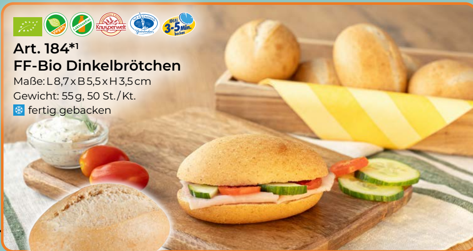
Art. 184*1 FF-Bio Dinkelbrötchen Maße: L8,7x B5,5x H3,5cm Gewicht: 55g, 50 St./Kt. ❄️ fertig gebacken